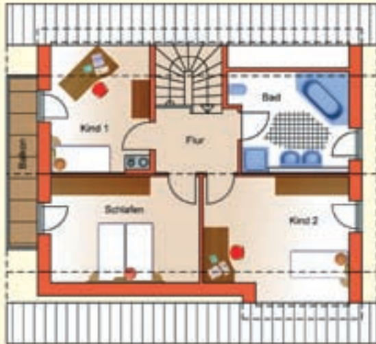
Dachgeschoss* 61,2 m 2

... Regensburg vereint hohen Wohnkomfort mit geringstem Energieaufwand zum erschwinglichem Preis.