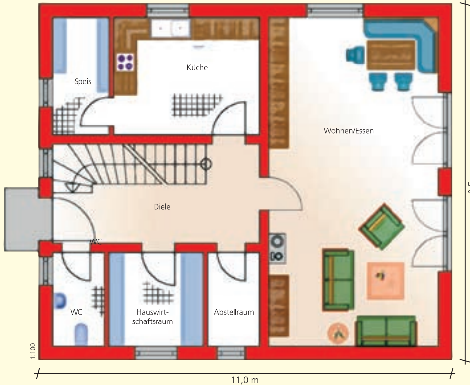
Erdgeschoss* 81,0 m 2